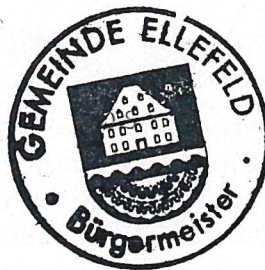
J. Kerber Bürgermeister

Bei der Behandlung und Beschlussfassung haben keine Mitglieder des Gemeinderates mitgewirkt, für die nach § 20 SächsGemO ein Mitwirkungsverbot besteht.